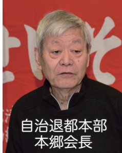
自治退都本部 本郷会長