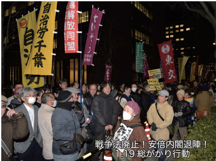
戦争法廃止! 安倍内閣退陣! 1.19 総がかり行動

安倍政権は、戦争法だけでなく、辺野古新基地建設も強行しようとしていますし、原発を次々と再稼働させようとしています。戦争法・辺野古・原発の根っこは同じです。戦争をできる国にして、軍需産