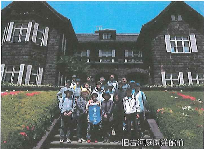
旧古河庭園洋館前