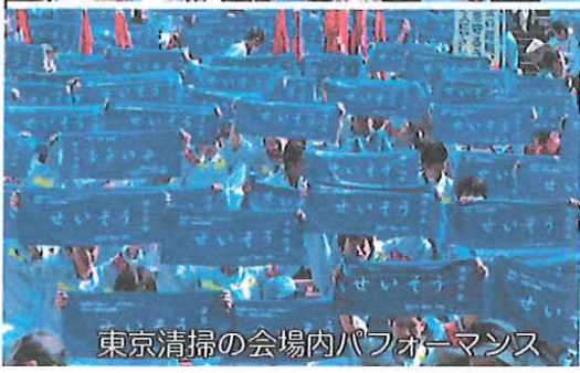
東京清掃の会場内パフォーマンス