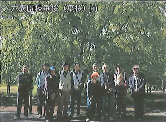
六義園枝垂桜（葉桜）前

今年のお花見ウォークは、「旧古河庭園洋館見学とツツジの名園めぐり」。4月25日、JR上中里駅に集合、最初の見学先旧古河庭園に向いました。旧古河庭園洋館は、明治政府の招請で来日し、日本近代建築の基礎を築いたジョサイア・コンドル最晩年の作で、和洋折衷の傑作といわれ、真鶴産新小松石の野面積み外壁や内装・調度も贅をつくしたものでした。洋館を建てたのは、日本の公害闘争の原点足尾銅山鉍毒事件を引き起こし