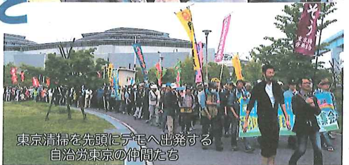
東京清掃を先頭にデモへ出発する自治労東京の仲間たち