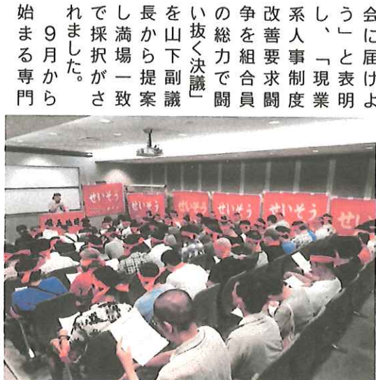
▲87名の結集で会場を埋め尽くした