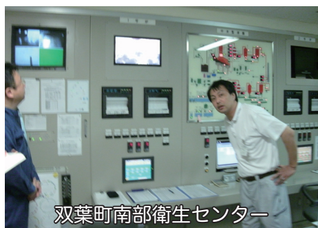
双葉町南部衛生センター

しかし、元の状態のセシウム137は金属であり、常温では液体です。バグ入口温度では飽和蒸気圧分の蒸気セシウムが存在するので、バグフィルターでは捕捉できません。そもそも、原子状の微粒子はバグでは捕捉できないはず。23区の清掃工場は水銀の不法搬入に苦しめられています。清掃工場での水銀の除去率は92〜95%と言われています。洗煙設備が設置されていれば、水銀もセシウムも濃度を測定できますが、福島の仮設焼却炉等はバグのみの設置なので、濃度測定は困難だと思います。