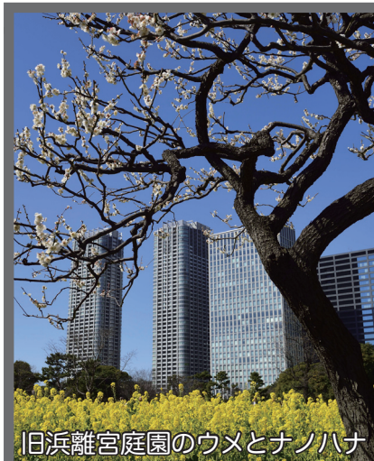
旧浜離宮庭園のウメとナノハナ