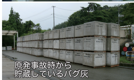
原発事故時から貯蔵しているバグ灰

また、汚染土再利用に建設される熔融炉は、故障を繰り返すのが目に見えています。熔融炉の補修は、セシウムどころかストロンチウムにも汚染され、原子炉に近い作業となるのではないかと危惧されます。(岩田)