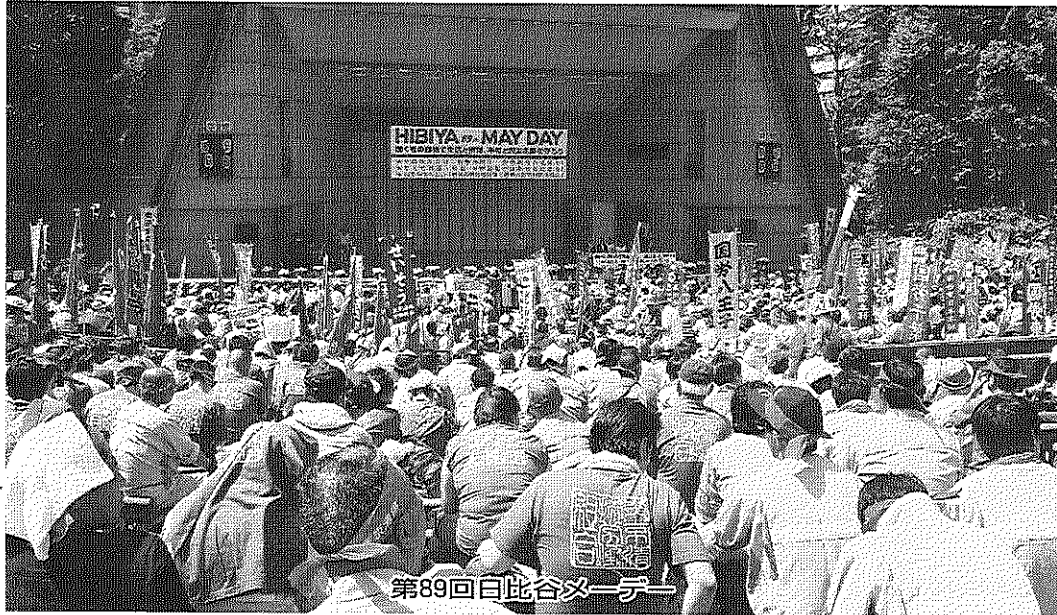
第89回日比谷メーデー

法廃止!のシユプレヒコールを挙げ、各地連別に隊列を組み整然と鍛冶橋まで行進し、わが組合の主張を都民にアピールしました。人員不足による人員配置が厳しいなか、各職場の協力を得て495名の組合員に結集していただきました。また、4月28日(土)第89回中央メーデーが開催され、東京清掃として93名が参加。千駄ヶ谷区民会館での集会後、中央メーデー会場である代々木公園までデモ行進を行いました。