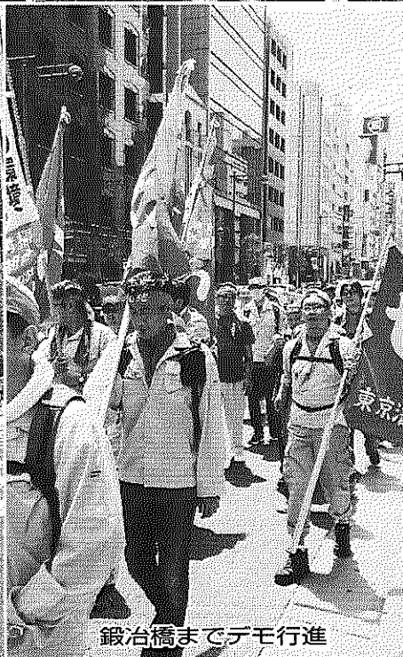
鍛冶橋までデモ行進