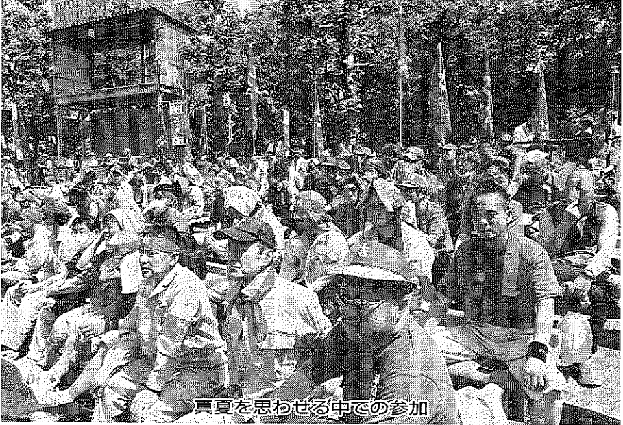
真夏を思わせる中での参加