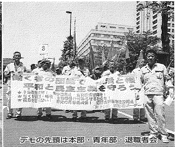
デモの先頭は本部・青年部・退職者会