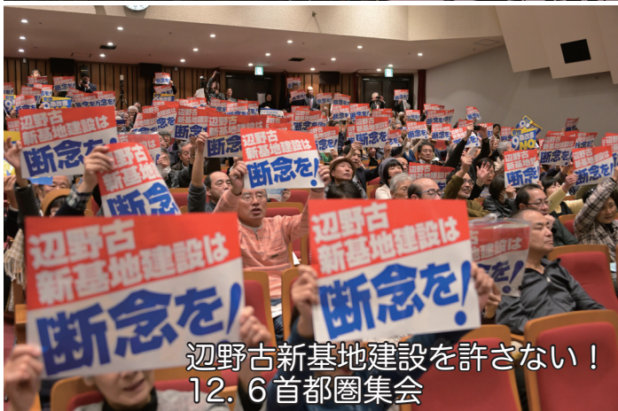
辺野古新基地建設を許さない！ 12.6 首都圏集会