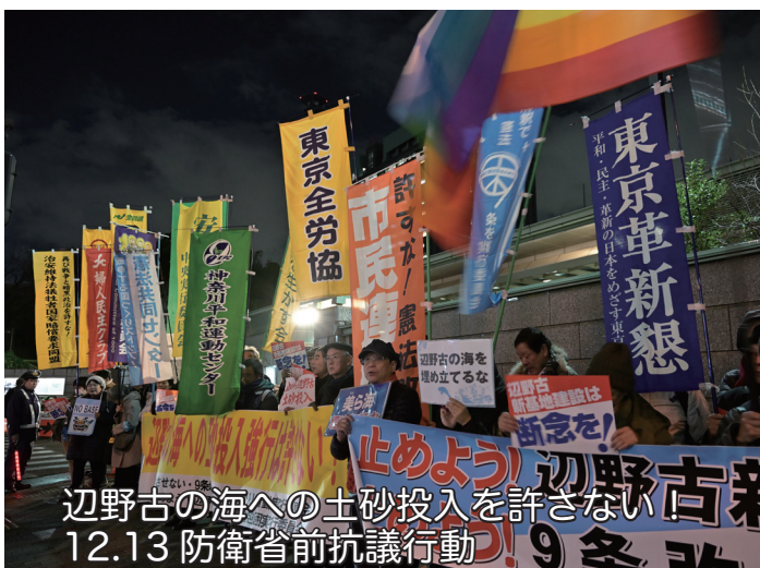
辺野古の海への土砂投入を許さない 12.13 防衛省前抗議行動