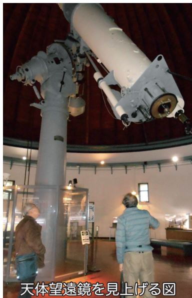
天体望遠鏡を見上げる図

の精密測定方法のお話でした。館内の地下に設置されている重力波を検知する重力干涉装置を足下に感じたり、展示物により設備の変遷を理解できたり、目一杯楽しみました。 見学の後、武蔵境駅前の居酒屋で反省会。次のイベントは「JAXA」(日本航空宇宙研究所) 見学の予定です。