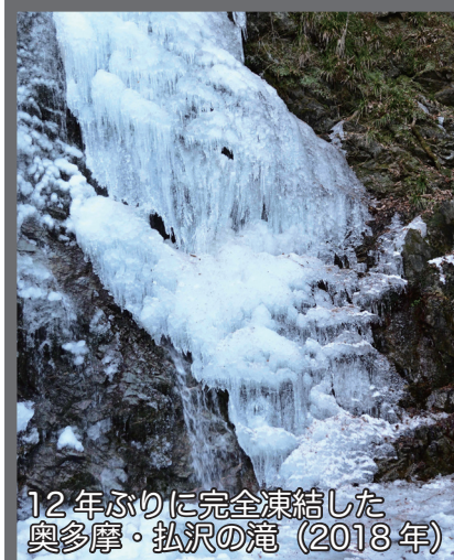
12年ぶりに完全凍結した奥多摩・払沢の滝(2018年)