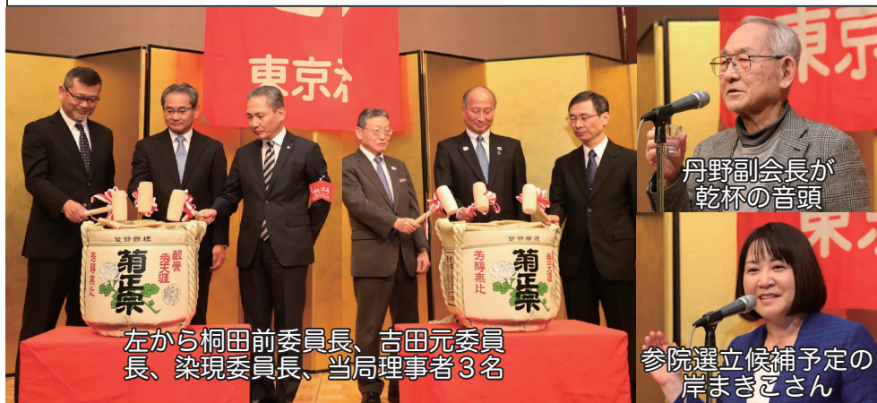
左から桐田前委員長、吉田元委員長、染現委員長、当局理事者3名