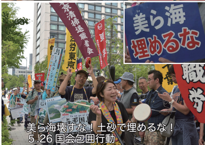
美ら海壊すな！土砂で埋めるな！ 5.26 国会包囲行動