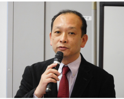
▲ 中里委員長「70年史を作る」