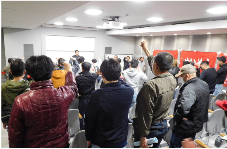
▲ 参加者全員で今年度の奮闘を誓い合った