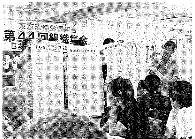
グループ討議の報告