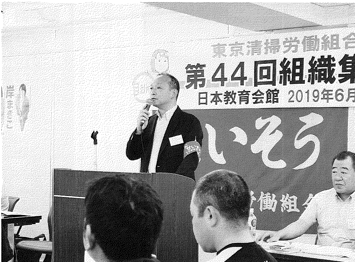
中里中央執行委員長のあいさつ