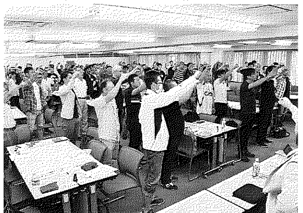
集會の最後は全体の団結がんばろうで終了しました

今年3月に行われた第89回の定期大会では、組織財政方針の総括と一部変更について確認いただいたが、そこに至るまでに各支部・地連・本部において沢山のご議論をさせて頂きました。 今年3月に行われた第89回の定期大会では、組織財政方針の総括と一部変更について確認いただいたが、そこに至るまでに各支部・地連・本部において沢山のご議論をさせて頂きました。