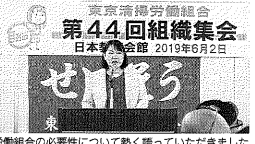
労働組合の必要性について熱く語っていただきました

6月2日(日)日本教育会館にて、第44回組織集會を開催しました。今回の組織集會は、役員の手不足や組合員の組合活動への結集力の低下など、本部・地連・(総)支部を問わず共通の課題であることから、これらの課題を克服するため、次世代を担う各支部の組合役員が中心となり支部の現状の把握と課題を整理し、継続的な 6月2日(日)日本教育会館にて、第44回組織集會を開催しました。今回の組織集會は、役員の手不足や組合員の組合活動への結集力の低下など、本部・地連・(総)支部を問わず共通の課題であることから、これらの課題を克服するため、次世代を担う各支部の組合役員が中心となり支部の現状の把握と課題を整理し、継続的な 参加者からは、「役員が話をする時に使う用語が難しい」「業務分担当がうまくいかずに特定の人だけ高い比重がかかっている」「若手組合員になるべくわかり易く引き継ぎができるようマニュアルを作ることが課題」など各支部の現状を報告し合いました。その他の意見として、「住民との接と、組合の意義は個人が疑