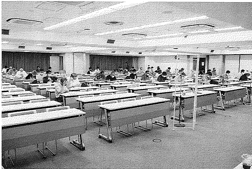
感染防止策を徹底し第1回中央委員会を開催

現在、人事院は一時金等の民間給与実態調査を終え、月例給の調査を9月末までに実施するとしていますが、これに伴い、勧告が出されるのか、一時金と月例給の勧告が同時に出来るのか、全て不透明な状況となっています。また、人事委員会勧告についても同様の状況と言えます。 少なくとも、例年より大幅に遅れることは間違いないと見られます。しかし、公務員の賃金を改正する場合には、例年取組ま