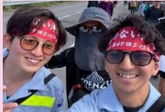
2人で参加してきました！