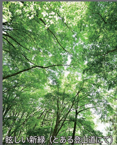
眩しい新緑 (とある登山道にて)

快晴の5月3日、平和憲法施行79年、有明防災公園で「つながろう、憲法いかして平和な世界を！26憲法大集会」が開かれ、昨年を大幅に上回る5万人が集まりました。退職者会の参加者も昨年より多い14名でした。