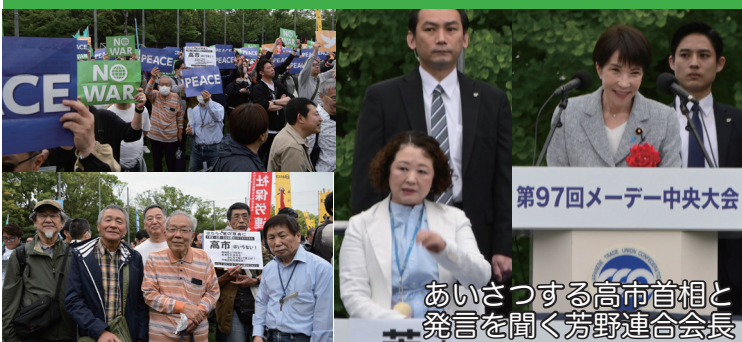
第97回メーデー中央大会