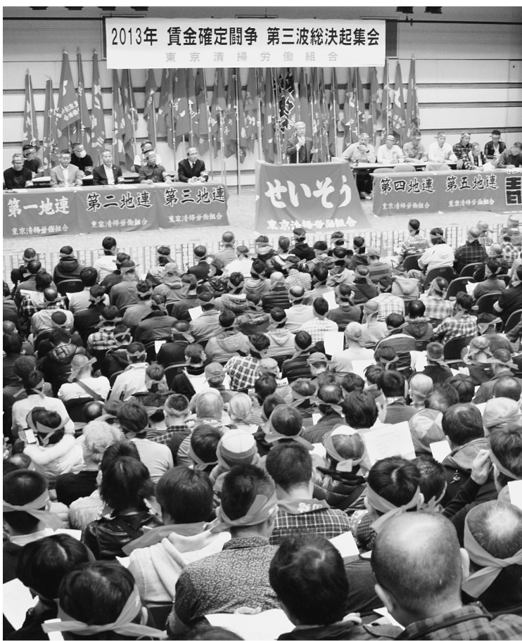
▲2013賃金確定闘争第三波総決起集会(全電通ホール)

10月8日の勧告式後、直ちに区長会に対して以下の内容の要請行動を実施した。①7年ぶりの引き上げ改定は一定程度評価出来るものである、②今回の引き上