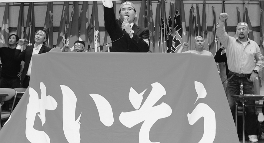
▲2013賃金確定闘争第3波総決起集会(全電通ホール)

10月8日の特別区人事委員会勧告は、公民較差(809円、0.2%)解消のため給料表を引上げ、2014年4月1日に遡って実施し、特別給は年間支給月数を0.25月引上げ4.2月としました。2015年4月1日から地域手当支給割合を2%引上げ20%とし、平均1.79%給料月額を引下げるとも勧告しました。人事院の給与制度の総合的見直しに追随するもので容認できません。