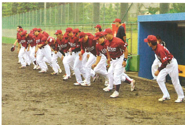
関東甲大会への出場権を懸けていざ出陣

2011自治体職員スポーツ(野球)大会都本部代表決定戦が6月18日(土)にあきる野市民球場で開催されました。一回戦、都庁職を相手に6対4で特別延長戦を制したわが『オール清掃』は、再び特別延長戦となった都本部代表決定戦で『港区職労』に1対2で惜敗を喫してしまい、関東甲大会出場権をもう一步のところまで逃してしまいました。