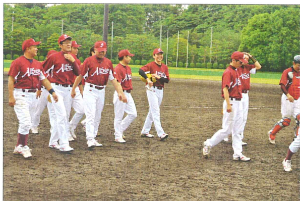
負けた口惜しさと健闘した満足感でグラウンドを去る

つながりません。逆に三回裏に痛いエラーで相手チームに先制点を許してしまいました。その後は両チームともに決定打が出ず、0対1で最終七回の攻撃を迎えました。 2アウト走者なしの絶体絶命の崖っぷちから『オール清掃』は再び脅威の粘りを見せます。三連続ヒットで同点に追いつき、再び二戦続けての特別延長戦に入りました。