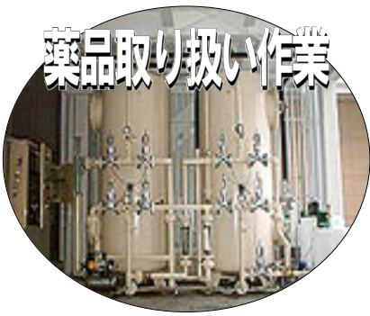
薬品取り扱い作業

一、技術系の監督要員を削減するとしているが、工場を熟知していなければ監督員たりえない。 経験の浅い区派遣職員が圧倒的に多く、運係係で具体的にプラント運転を行っている設備管理の監督員は必要である。