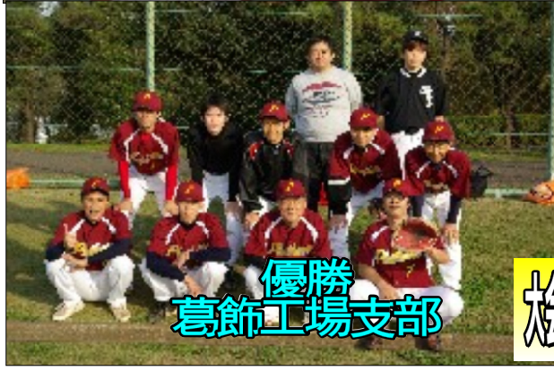
優勝 葛飾工場支部