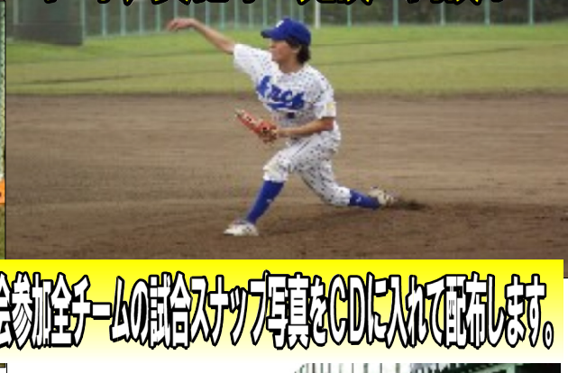
大会参加チームの試合スナップ写真とCDに入れて配布します。