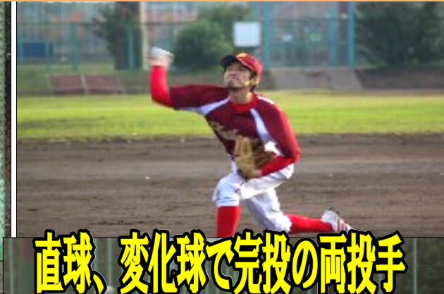
直球、変化球で完投の両投手