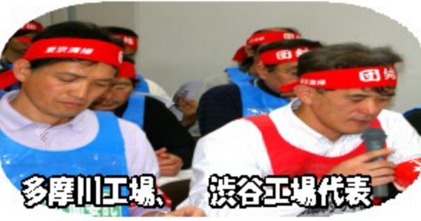
多摩川工場、渋谷工場代表