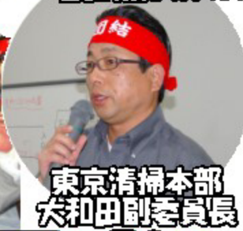
東京清掃本部 大和田副委員長