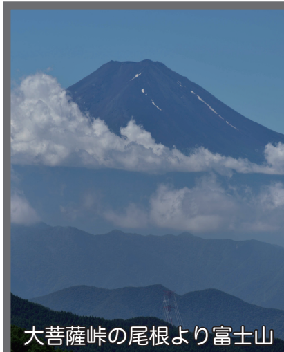
大菩薩峠の尾根より富士山