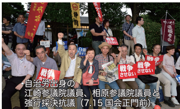
自治労出身の江崎参議院議員、相原参議院議員と強行採決抗議 (7.15国会正門前)