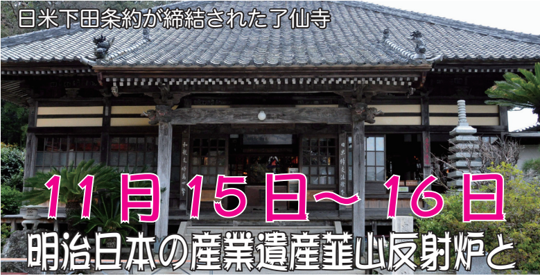
日米下田条約が締結された了仙寺