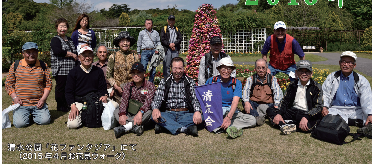
清水公園「花ファンタジア」にて (2015年4月お花見ウォーク)