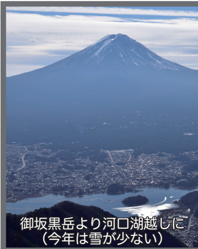
御坂黒岳より河口湖越しに (今年は雪が少ない)