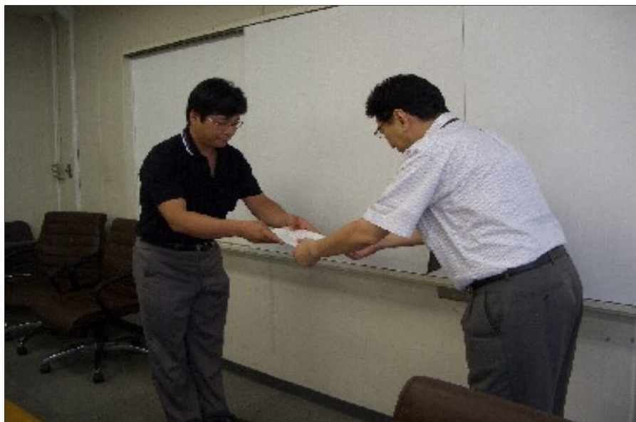
森人事課長に要求書を手渡す横須賀中央執行委員